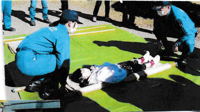
担架による救助訓練