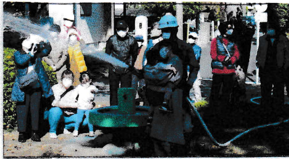
スタンドパイプでの消火訓練