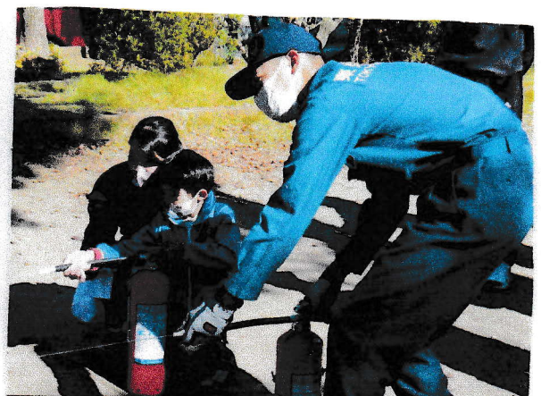
消火器での消火訓練