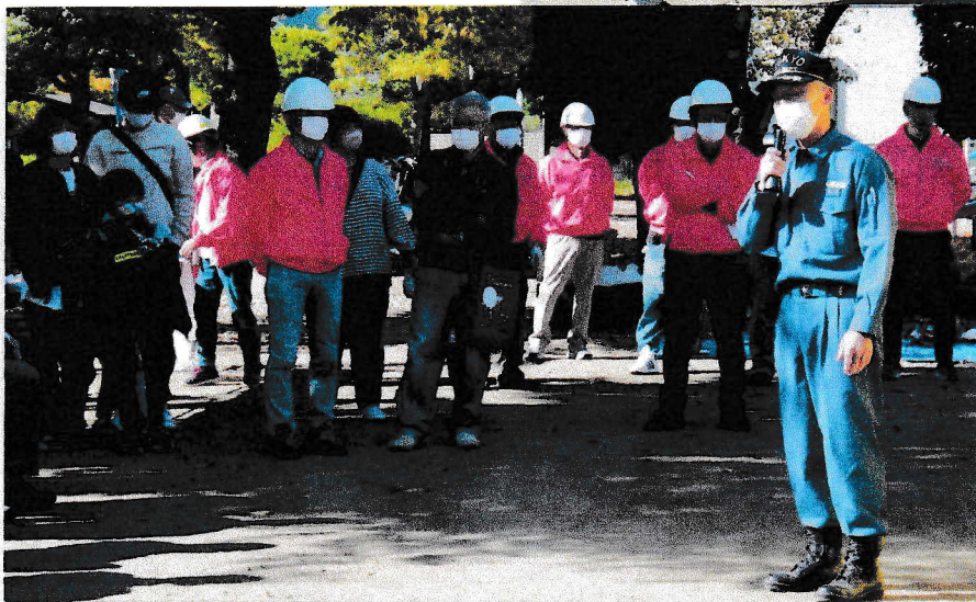
北多摩西部消防署 浦島様