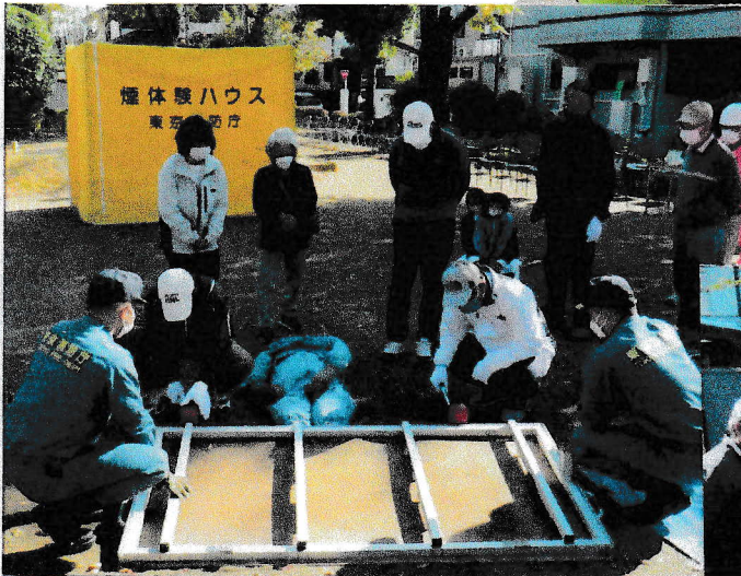
ジャッキを使用したの家屋倒壊救出訓練